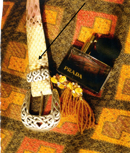
Rechts: Gürtel mit Pythonlederoptik von Nurance, Ohrhänger von Stephanie Thonet. „L'Eau Ambrée“ von Prada. Paillettentop von Manoush, Seidenhose von Gudrun Sjödén. Ring von Rebecca.